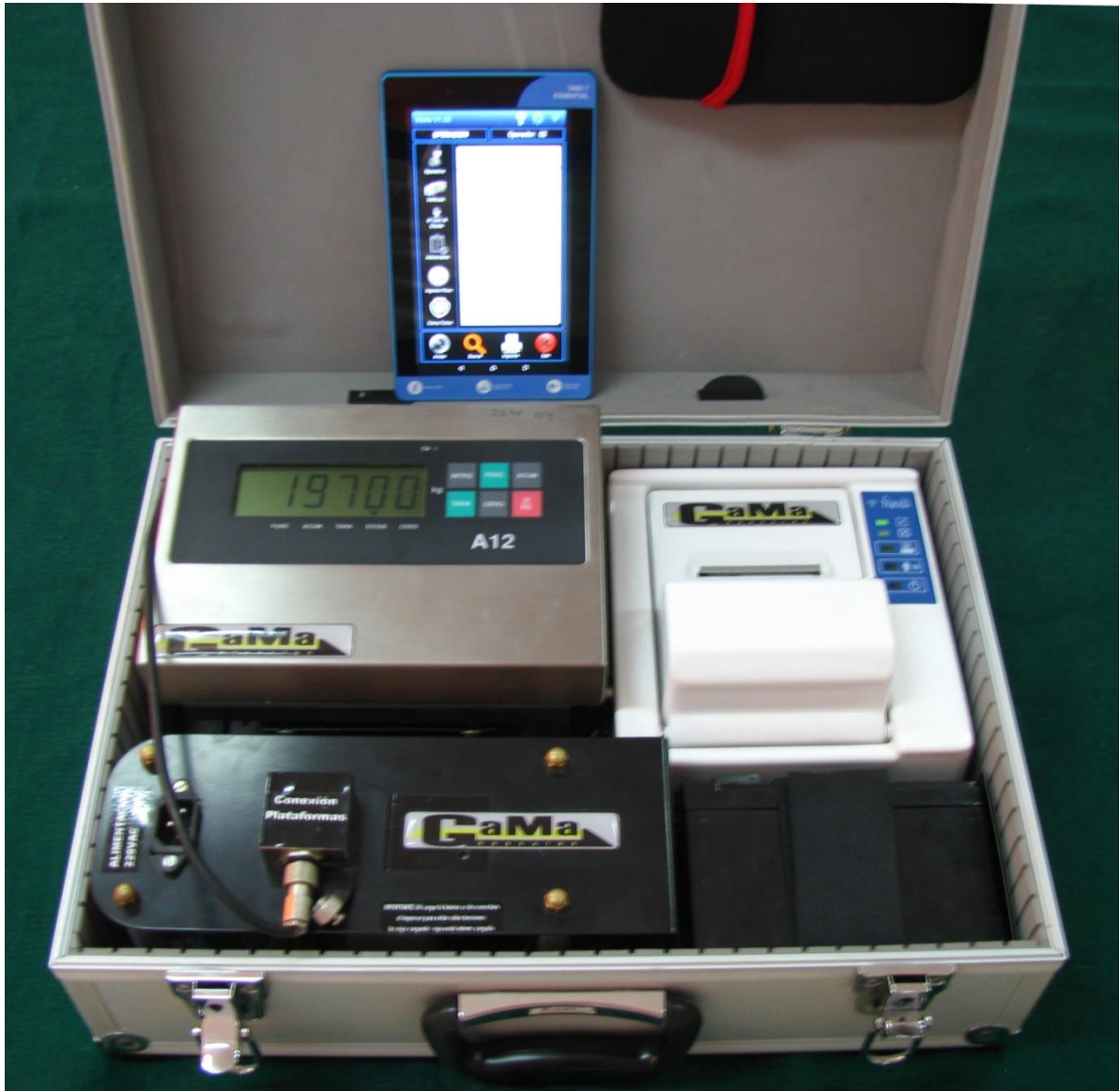
Fotografía del maletín equipado, a modo ilustrativo, con un indicador A12 de acero inoxidable